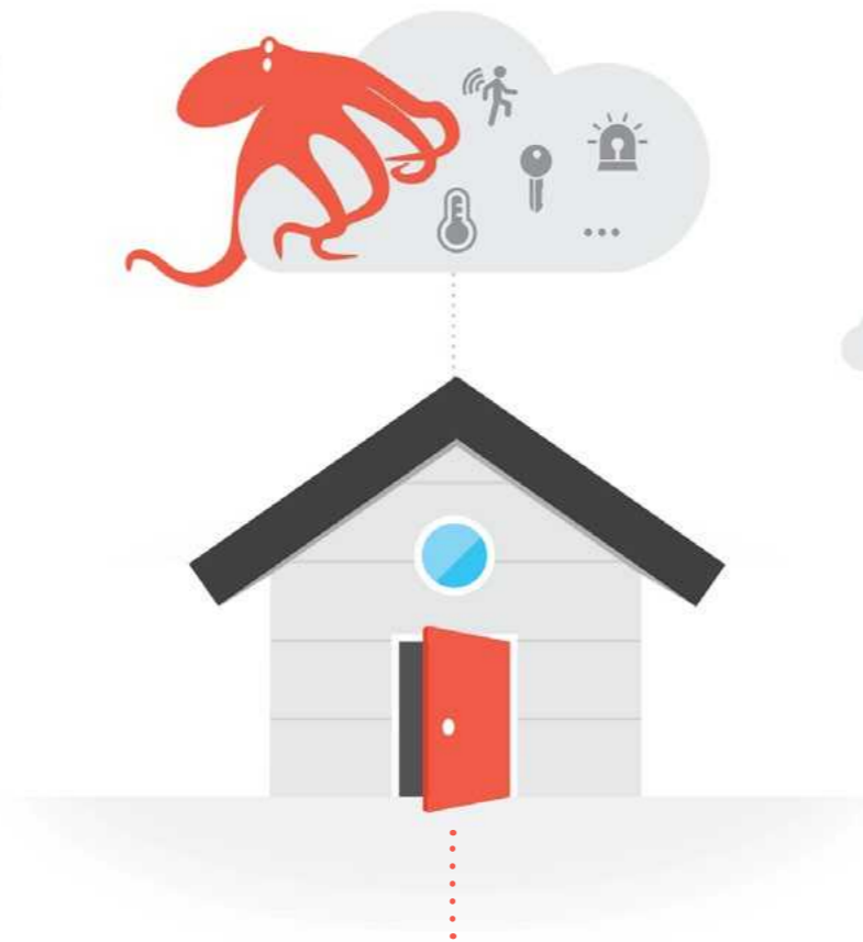
AUTRES FABRICANTS Mes données dans le cloud

Contrairement à de nombreuses solutions domotiques, toutes les données personnelles utilisées dans la Smart Home de Loxone sont protégées et stockées dans votre Miniserver. Cela signifie que les données telles que la présence, la température, l'alarme et toute autre information ne sortent pas de votre logement. "Ma maison, Mes données".